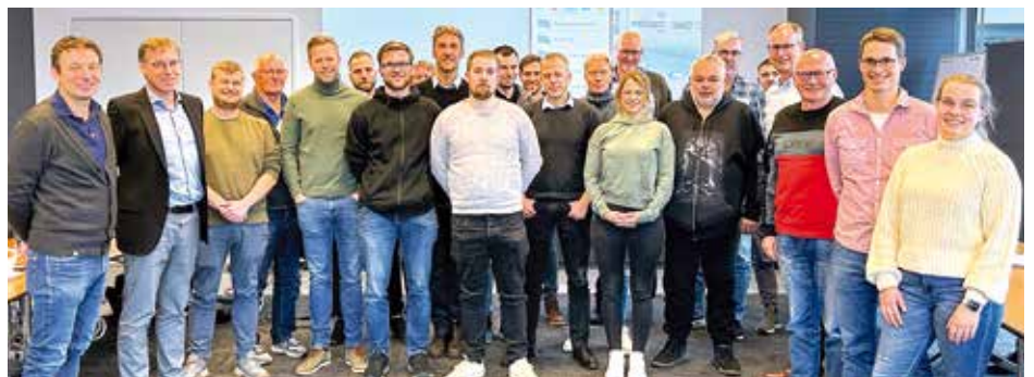
Über 20 Führungskräfte aus der Bäderbranche kamen zum Netzwerktreffen bei den Stadtwerken zusammen, um sich über aktuelle Bädertemen fachlich auszutauschen. Text + Foto: Stadtwerke Huntetal

die Inhalte der Badewasserverordnung und neue Richtlinien in der Bäderbranche diskutiert. Am Ende der Veranstaltung fand für alle Teilnehmer eine Führung im Hallenbad Delfin statt.