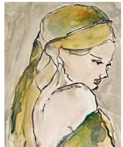
Tini Reimann-Schröder arbeitet mit Aquarellfarben. Am liebsten auf einer Leinwand mit Struktur, aber natürlich auch auf Papier.