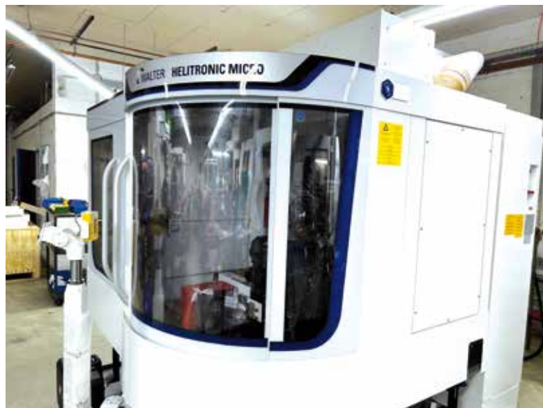
Durch den Einsatz modernster Technologie und hochwertiger Materialien ermöglicht sie eine präzise und effiziente Herstellung von Werkzeugen in mikroskopischen Dimensionen.

»REDAKTIONSSCHLUSS« Mittwoch, 17. Januar 2024