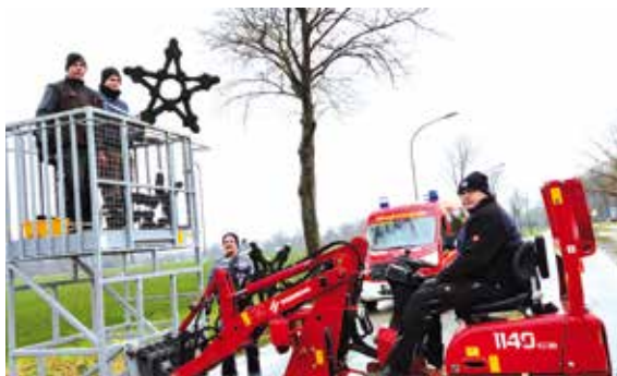
Das Auf- und Abhängen der Weihnachtssterne wird künftig von der örtlichen Feuerwehr übernommen.