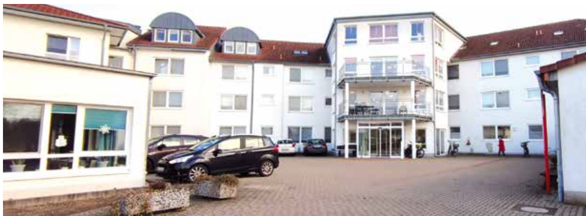
Das Seniorenheim Familie Gärtner in Pr. Ströhen nebst der Pr. Ströher Servicegesellschaft hat wegen drohender Zahlungsunfähigkeit einen Insolvenzantrag gestellt. Der Betrieb läuft unverändert weiter.