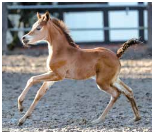
Stutfohlen von EBT Bel Subayan aus der IS Eminta von Parys K., unten Zuchthengst EBT Bel Subayan