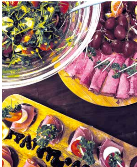
Die auf dieser Seite abgebildeten Beispiele vom Frühstücksbuffet in „Luka's Hofcafé“ in Hüde sind mal etwas anderes, als sonst üblich.

Bis zu 100 Plätze stehen dann bei schönem Wetter bereit. Und auch dort kann man dann alle angebotene „Leckereien“ vom Frühstücksbuffet oder auch die verschiedenen Torten- und Kuchensorten stehen dann für die Gäste bereit.