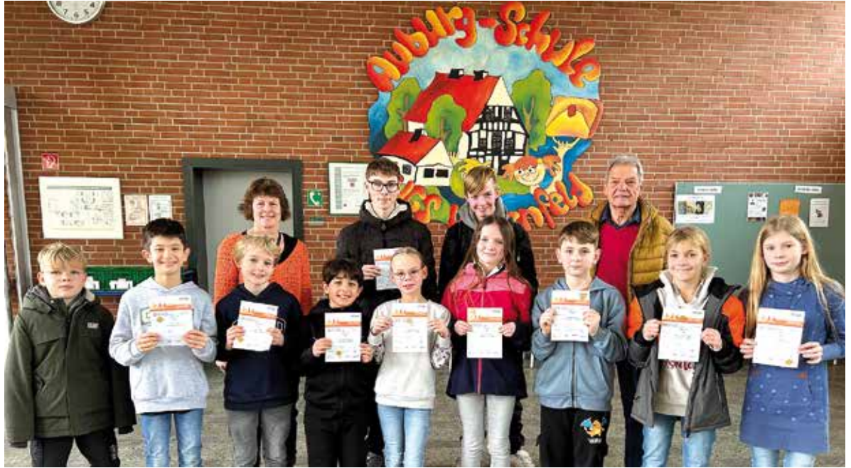
Viele glückliche Kinder gab es nach der Übergabe des Deutschen Sportabzeichens in der Auburg-Schule in Wagenfeld. Insgesamt wurden 112 Schülerinnen und Schüler ausgezeichnet. Unser Foto zeigt die mit dem Goldenen Sportabzeichen.

zeichenbesitzerinnen und -besitzer versprachen abschließend, dass sie auch in diesem Jahr wieder eifrig für das Erlangen des Deutschen Sportabzeichens trainieren werden. -kr