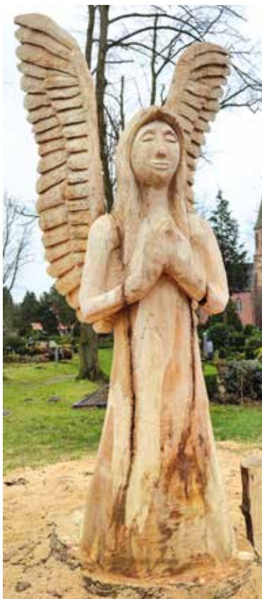
Ein hölzerner Engel zierte seit kurzem den Eingangsbereich zum Pr. Ströher Friedhof vom Gemeindehaus aus.

Auch in Sachen „Schönheitschirurgie“ ist der Kettensägenexperte versiert, wie einzelne Vorbeikomende bemerkten. „Die Gesichtszüge des Engels haben sich vom